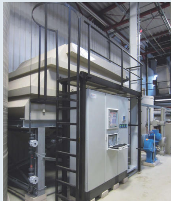
Skříňkový rozvaděč s vizualizací