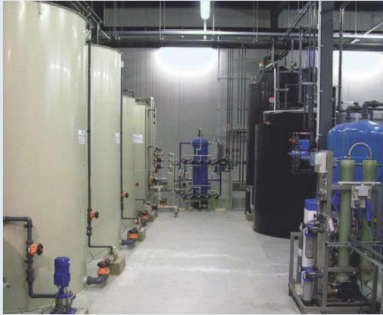
Čistička odpadních vod