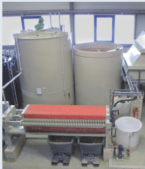
Čistička odpadních vod Zn/Ni