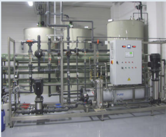
Systém reverzní osmózy